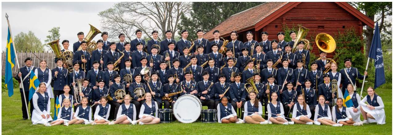
Mjölby ungdomsmusikkår i maj 2024