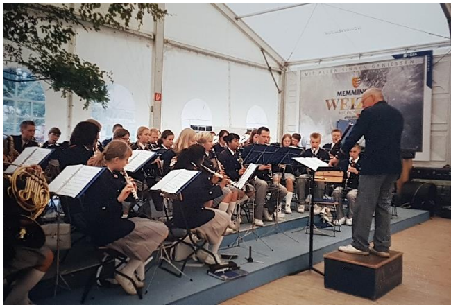
Mumk på resa i sydligaste Tyskland år 2000. De spelade även på Expo 2000 i Hannover.

– Men allra bäst har nog den sociala gemenskapen varit, säger han och det känns som att musiken håller honom ung både i kropp och sinne.